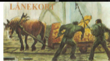
Biblioteken i Smedjebackens kommun