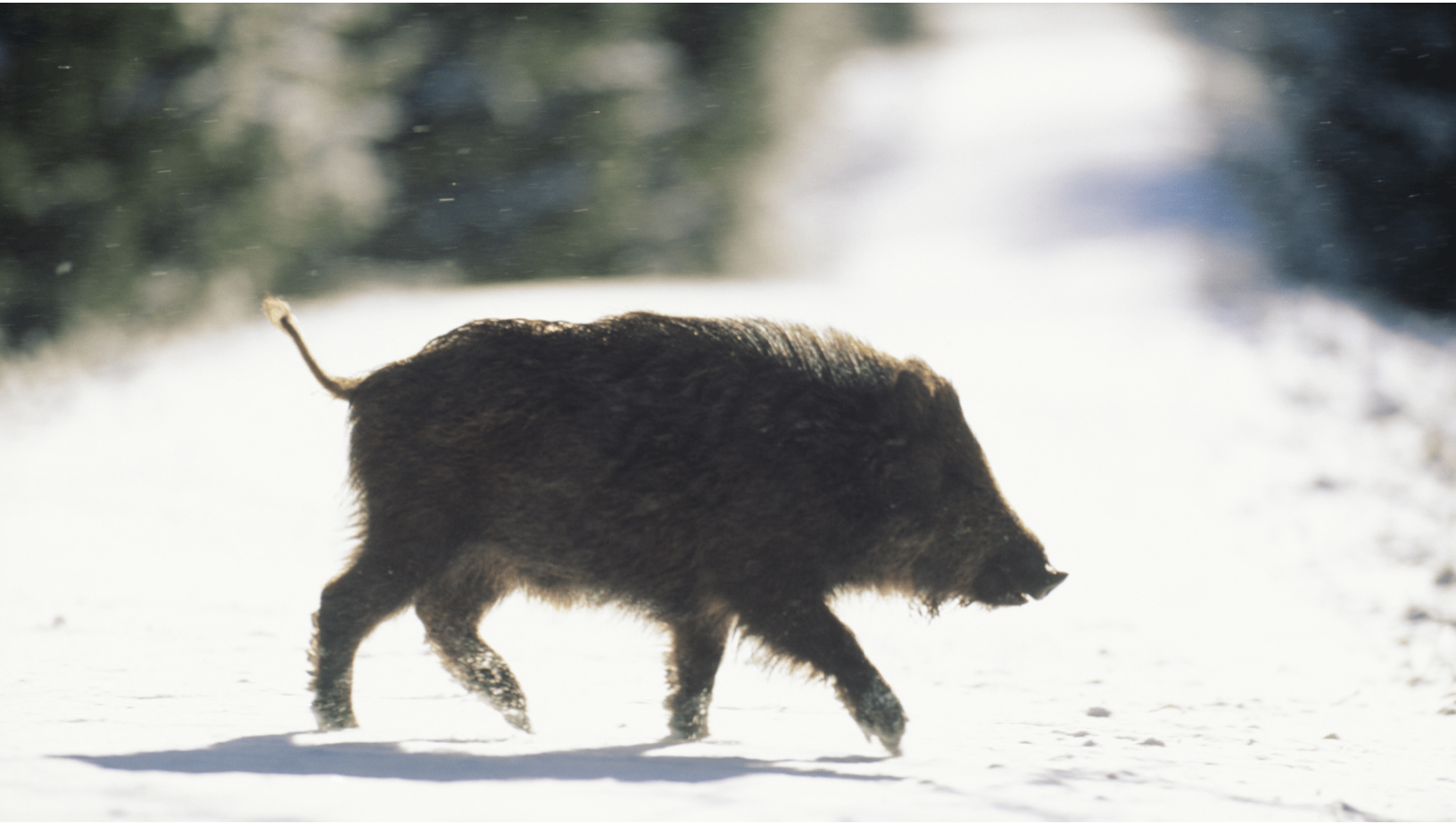
Genrebild, vildsvin.