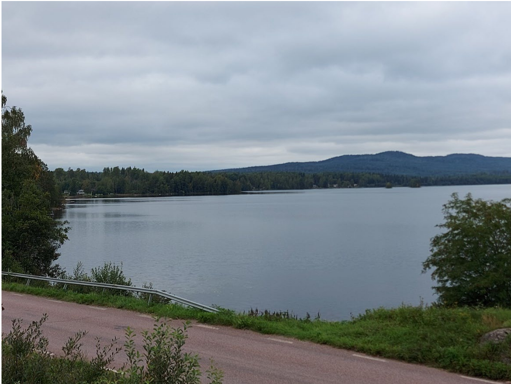
Bilaga 3. Foto med siktlinjje 3, från den enda punkt/sträckan utmed Stora Tolvsbovågen där Västra Sveten kan skymtas.