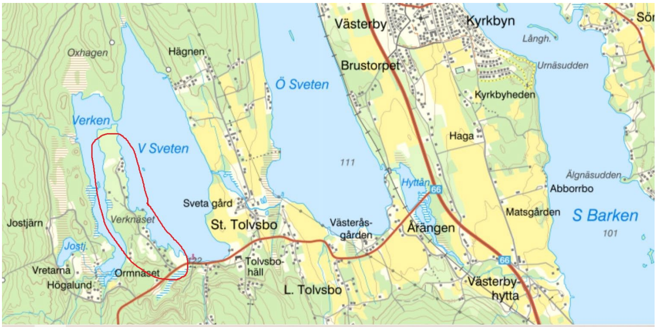
Karta över området. Verksnaset inringat i rött.